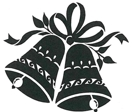
André Dahlhaus Bürgermeister